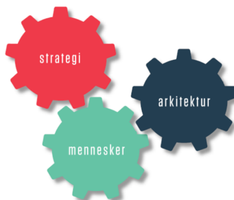
Figur 1: prinsipp lagt til grunn for kontorkonsept, arkitektur som verkemiddel. (Signal arkitekter, 2018)

Det er utvikla eit arbeidsplasskonsept som skal nyttast i utforminga av arbeidsplassane i nybygget, som òg er vedteken i fylkestinget. Utgangspunktet for arbeidet med å velje eit kontorkonsept var at «Utvikling av kontorløysing er organisasjonsutvikling, areal er eit verkemiddel». Arkitektur legg til rette for at menneska som jobbar i bygget kan løyse dei oppgåvene dei skal løyse på best mogeleg måte, for å nå dei mål og strategiar som er sett for verksemda. Fylkeskommunen står føre ei tid med store endringar og utvikling, med samanslåing til Vestland fylkeskommune og ein regionreform med nye oppgåver, i tillegg til den store