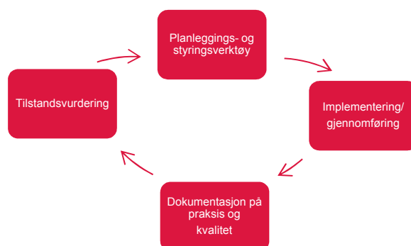
Figur: kvalitetssikring som ein syklus

Planleggings- og styringsverktøy definerer m.a. innhald og framdrift i fagskuleutdanningane. Dei mest sentrale dokument er her a) Fagplan (plan for utdanninga sitt faglege innhald og b) Plan for gjennomføringa av utdanninga (tid/stad). Andre dokument som kan ha betyding for fagskuleutdanning er nasjonale og regionale strategiplanar samt utviklingsplanar for den enkelte skule.